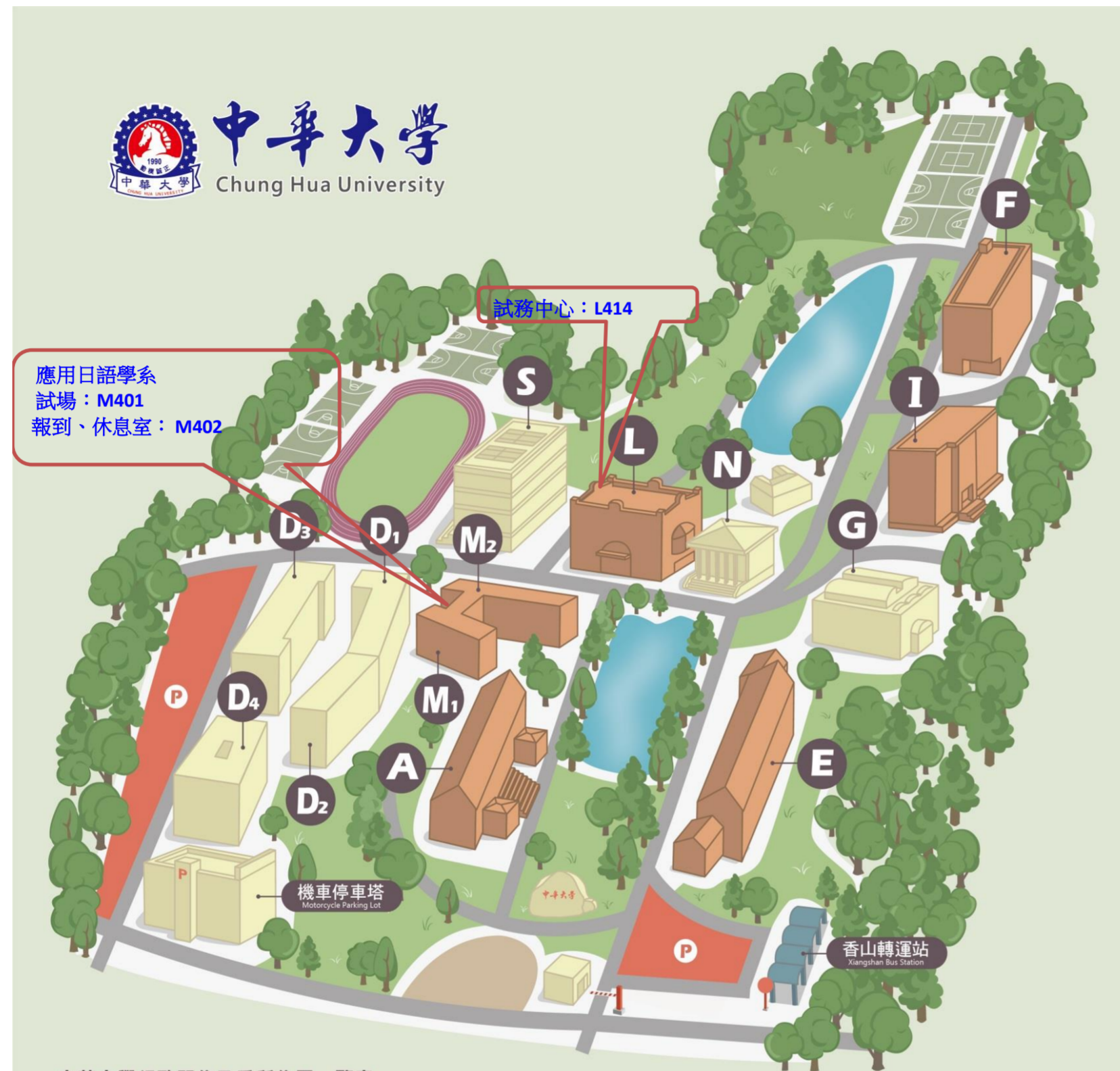
中華大學行政單位及系所位置一覽表 Chung Hua University Campus Map